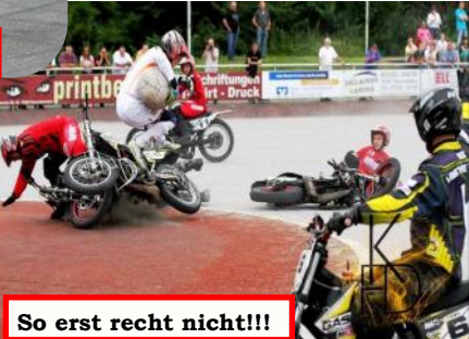
So erst recht nicht!!!