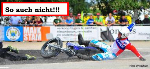
So auch nicht!!!