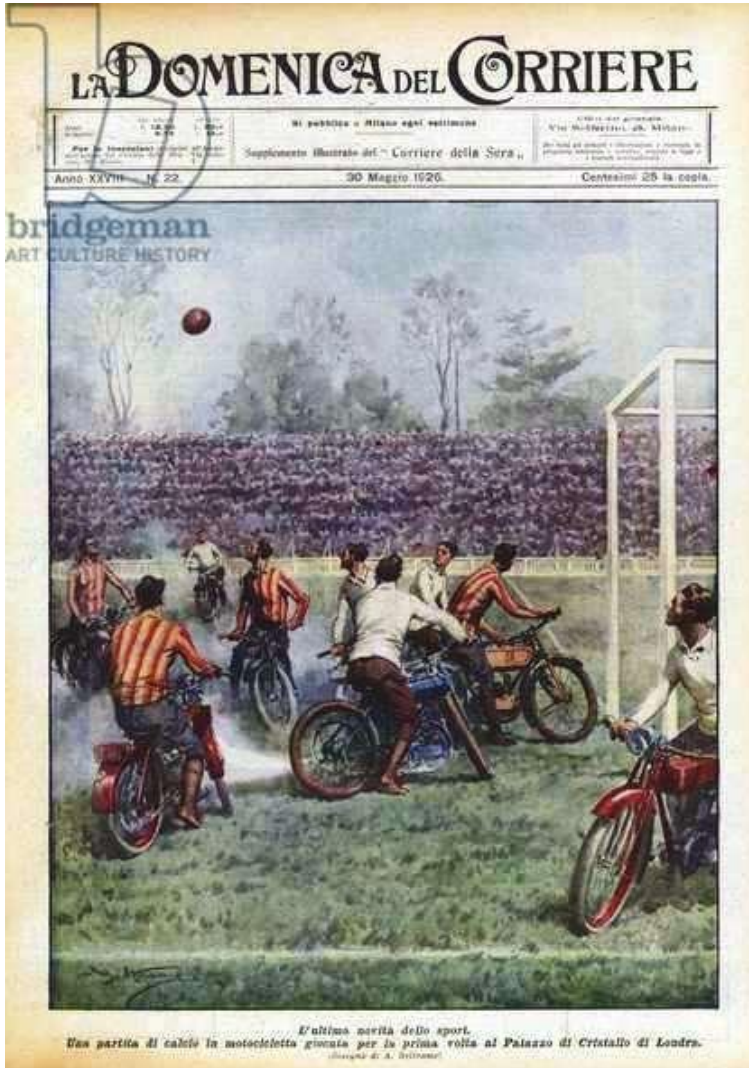
Das Neueste im Sport. Ein Motorrad-Fußballspiel, das zum ersten Mal im Crystal Palace in London ausgetragen wurde. Illustration für Courier Sunday, 30. Mai 1926.